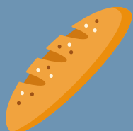
PRODOTTI DA FORNO