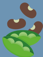
LEGUMI E CEREALI