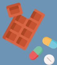
BARRETTE E INTEGRATORI