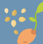
GIARDINAGGIO E ZOOTECNICA