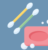
CURA DELLA PERSONA E DELLA CASA